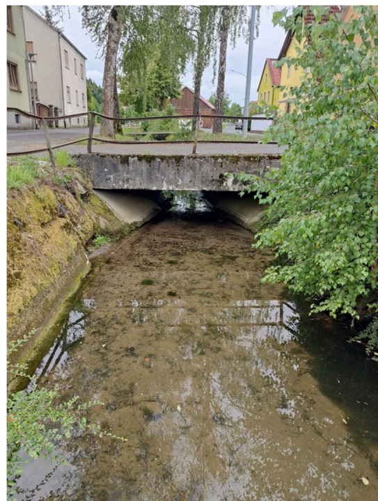
© Schlicht Lamprecht Kern Architektur Stadtplanung

Geplante Maßnahme: Der Weipoltshausener Dorfgraben ist das zentrale ortsbildprägende Element in Weipoltshausen. Der Dorfgraben soll so weit wie möglich ökologisch aufgewertet und erhaltenswerte Elemente saniert werden.