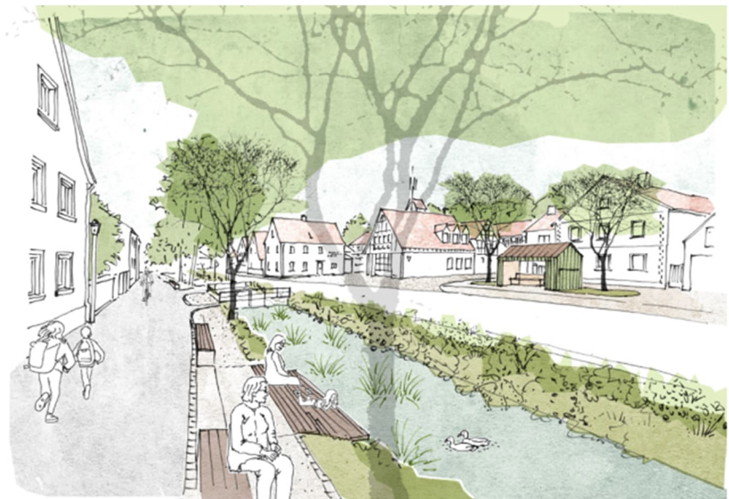
© Schlicht Lamprecht Kern Architektur Stadtplanung

Aufklärung der Grundeigentümer nach § 5 Abs. 1 Flurbereinigungsgesetz (FlurbG)